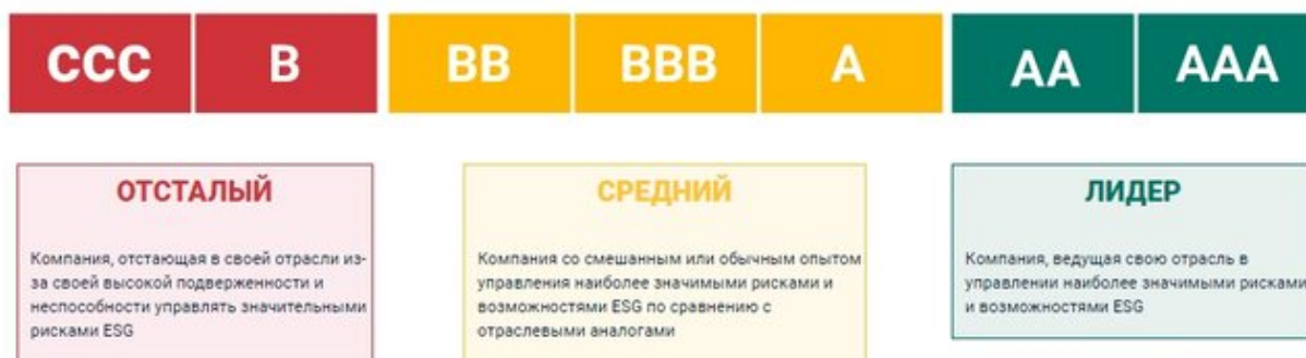
Рисунок 3. Разделение компаний по принципу агентства MSU

Правильным выходом из сложившейся ситуации было бы создание общей, единой системы оценивания для рейтинговых агентств. Сделать соответствие требованиям ESG более понятным, объективным процессом.