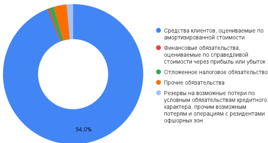
Рисунок 4 – Структура обязательств Джей энд Ти Банка на 1 апреля 2021 года