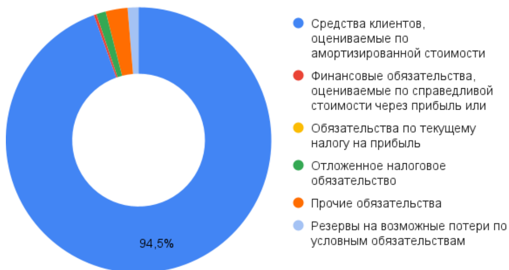
Рисунок 5 – Структура обязательств Джей энд Ти Банка на 1 января 2021 года

По состоянию на 1 апреля 2021 года обязательства Джей энд Ти Банка увеличились на 585059 тыс. руб. (на 4,6%) по сравнению с 1 января 2020 года. Однако, как и прежде большую часть обязательств составляют средства клиентов. Структура обязательств изменилась в сторону увеличения средств клиентов на 484 591 тыс. руб. (на 4,1%), при этом средства кредитных организаций выросли на 174 886 тыс. руб. (на 38,5%), средства клиентов юридических лиц сократились на 262 065 тыс. руб. (на 9,0%), а средства физических лиц и индивидуальных предпринимателей увеличились на 571 770 тыс. руб. (на 6,7%). Выросли финансовые обязательства на 12 664 тыс. руб. (на 30,8%), прочие обязательства организации на 60 216 тыс. руб. (на 17,9%), величина резервов на возможные потери по условным обязательствам кредитного характера, прочим возможным потерям и по операциям с резидентами офшорных зон на 28 579 тыс. руб. (на 17,0%). Обязательства по текущему налогу на прибыль сократились на 991 тыс. руб. (на 100,0%), а величина отложенного налогового обязательства не изменилась.