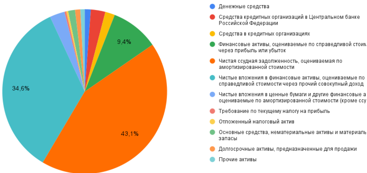
Рисунок 3 – Структура активов Джей энд Ти Банка на 1 января 2021 года

Наибольшую часть в структуре активов составляет чистая ссудная задолженность, оцениваемая по амортизационной стоимости. Можно заметить, что структура активов изменилась в сторону увеличения средств в кредитных организациях на 1 229 427 тыс. руб. или в 4,1 раза, денежных