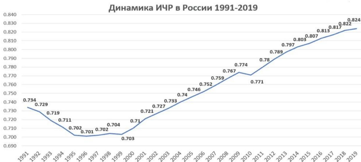
Рисунок 1 – Динамика ИЧР в России в 1991–2019 годах

По рисунку 1 мы можем наблюдать сначала спад уровня жизни в 90-х годах в связи со сложившейся после распада СССР обстановкой. Затем мы видим постоянное увеличение уровня жизни в России, начиная с 1999 года,