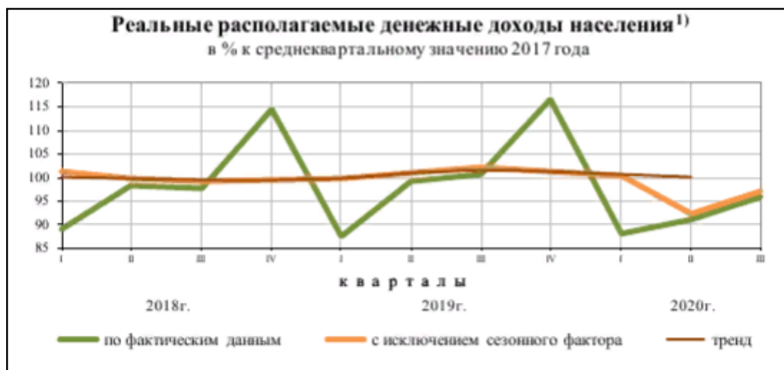
Рисунок 3 – Реальные располагаемые денежные доходы населения в % к среднеквартальному значению 2017 года

Проанализируем доходы населения. Как видно по таблице 1, реальные денежные доходы в третьем квартале 2020 г. по сравнению с соответствующим периодом предыдущего года снизились на 3,6%. В январе-сентябре 2020 г. по сравнению с январём-сентябрём 2019 г. доходы также снизились на 3,6%. Реальные располагаемые денежные доходы в третьем квартале 2020 г. по сравнению с соответствующим периодом предыдущего года снизились на 4,8%. По данным, в январе-сентябре 2020 г. по сравнению с январём-сентябрём 2019 г. доходы снизились на 4,3%.